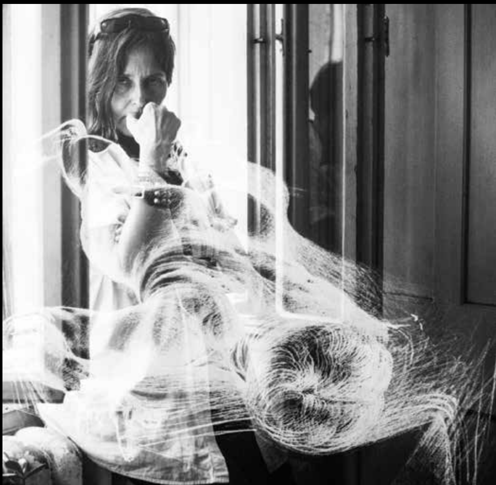
El Kazovszkij festőművész