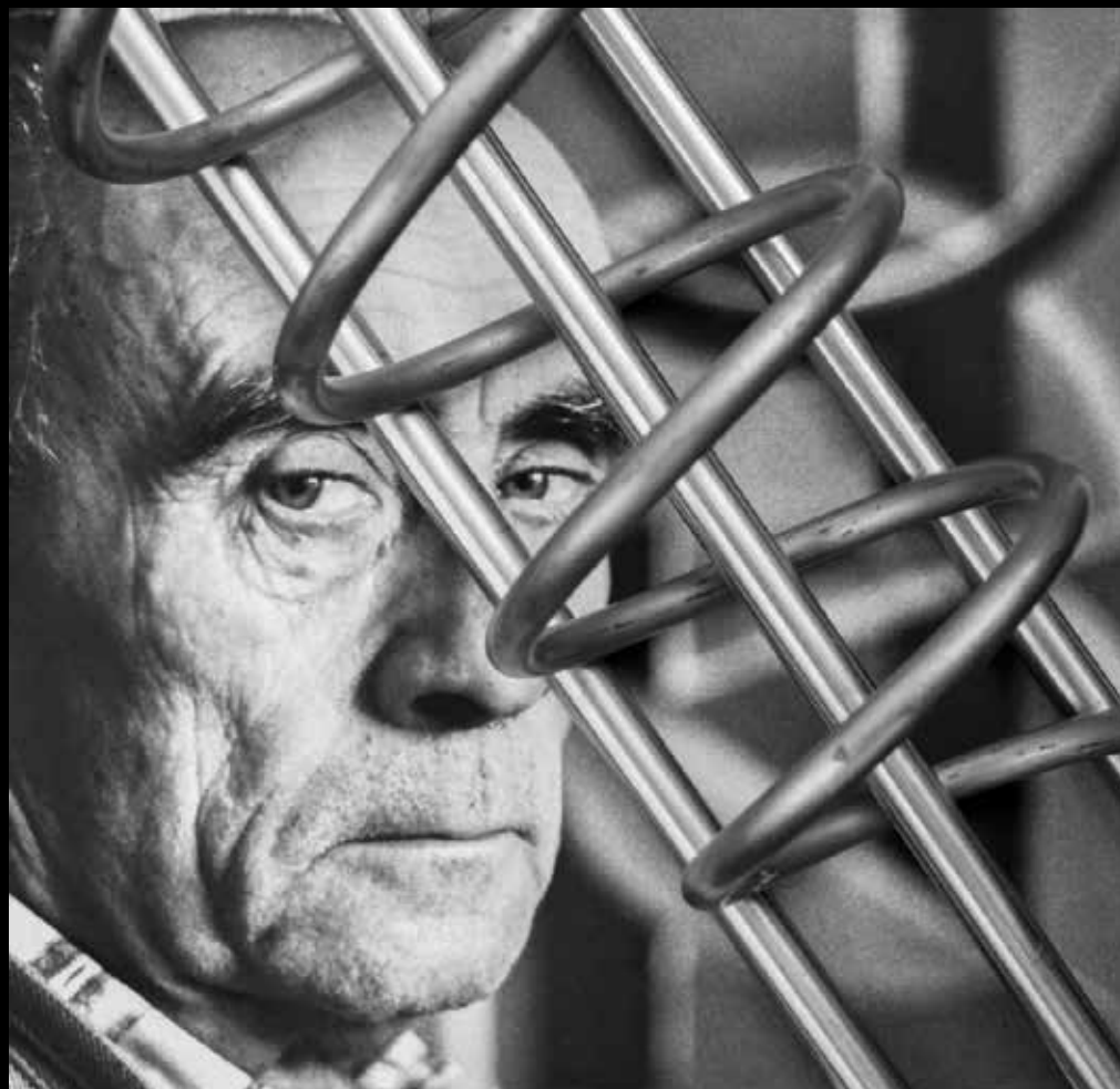
Kassák Lajos festőművész, költő