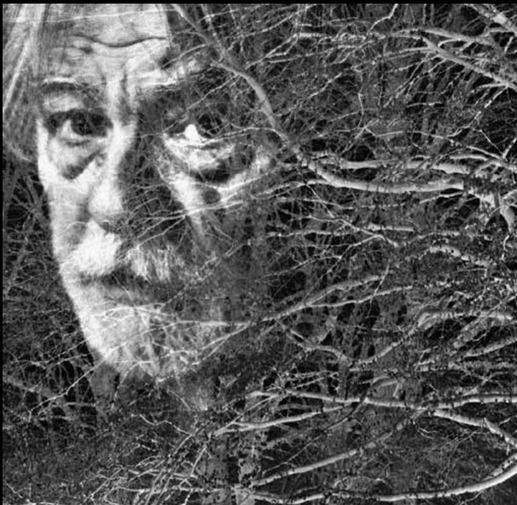
Parti Nagy Lajos író