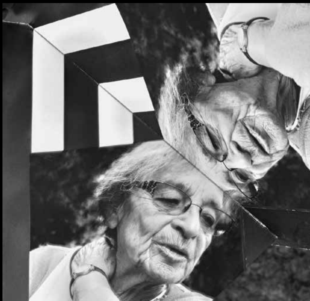
Heller Ágnes filozófus